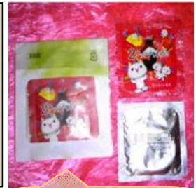
避妊具の画像掲載

一方『学校裏サイト』は、小学校 70 校で 153 サイト（前月比±0）、中学校 37 校で 327 サイト（前月比+7）、合計 107 校で 480 サイト（前月比+7）、夏休み中に更新されたサイトの数は 46 でした。