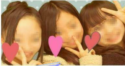
いまだに多いプリクラ画像の掲載

総合学習センターで行っているネットパトロールにより確認された8月25日現在の相模原市内小・中学校における『問題のある個人のプロフィールサイト』については、中学校32校で768サイト（前月比+15）となりました。夏休み中のサイトの増加は普段の月と比べるとやや少なめでした。