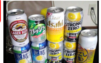
ネットパトロール常駐員からの報告画像より「呑みな〜う」

インターネット上に「クリスマス会」や「新年会」と称して、お酒を飲んだことを自慢げに書き込んだり、喫煙している画像を投稿する子どもが増えます。また最近、画像だけでなく、 動画を投稿する 子どもも見られます。Twitterなどでインターネット上に公開した情報は 二度と回収できません 。実際に、LINE上で送付した自分の画像を勝手にTwitterに公開されてしまうトラブルもありました。法に触れる行為をさせないことももちろんですが、インターネット上に安易に画像・動画を載せる危険性についても子どもたちに指導することが大切です。