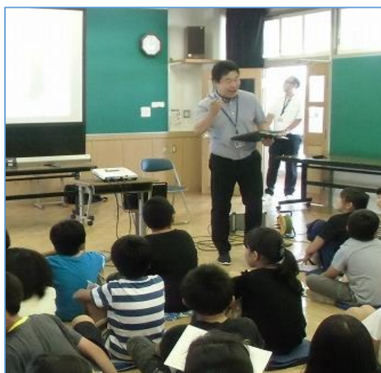
講座の様子（桜台小学校）

また、桜台小学校では、6月25日（月）に6年生と保護者、6月28日（木）には、5年生と保護者を対象に、「情報モラルとマナーについて」をテーマして講座を行いました。