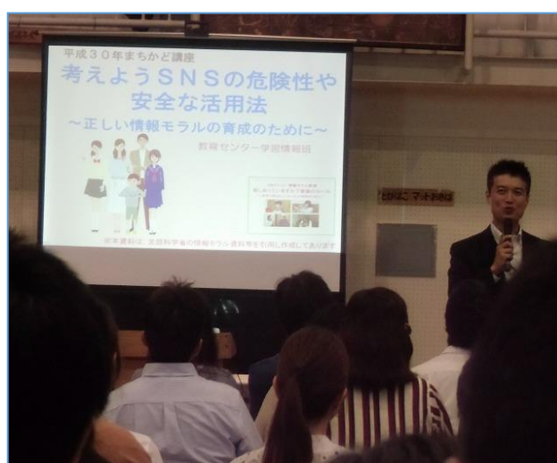
講座の様子（作の口小）

最後は、フィルタリングや家庭でのルール作りなど、子どもの発達段階に応じた大人の関わりが重要であることを確認しました。