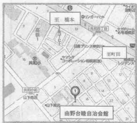
由野台睦自治会館地図