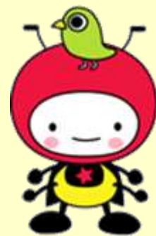
城山公民館イメージキャラクター 「しろっぴー」